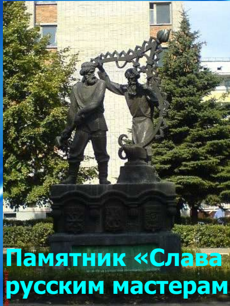
Памятник «Слава русским мастерам»